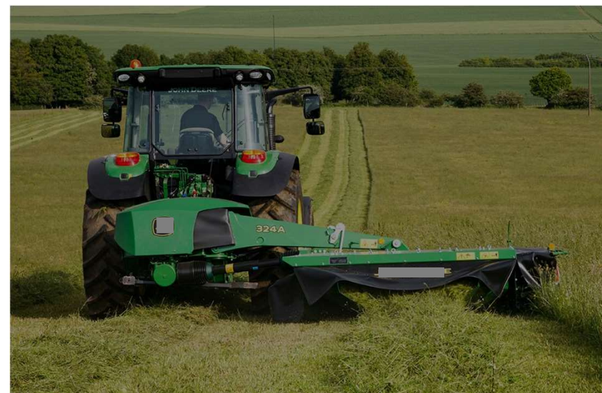
Falciacondizionatrice posteriore (trainata)