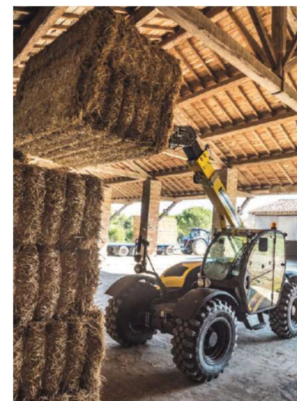
Movimentatore telescopico (semovente)