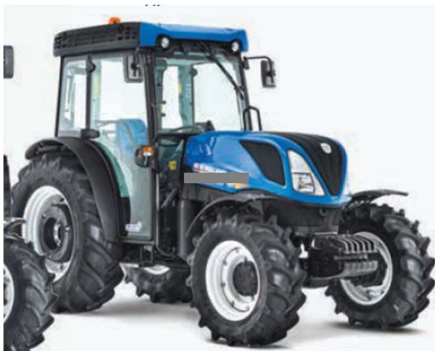
Trattore agricolo gommato Regolamento UE 167/2013