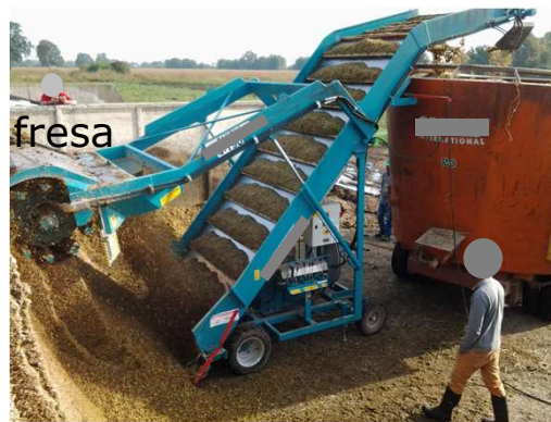
Dessilatore elettrico a fresa (semovente)