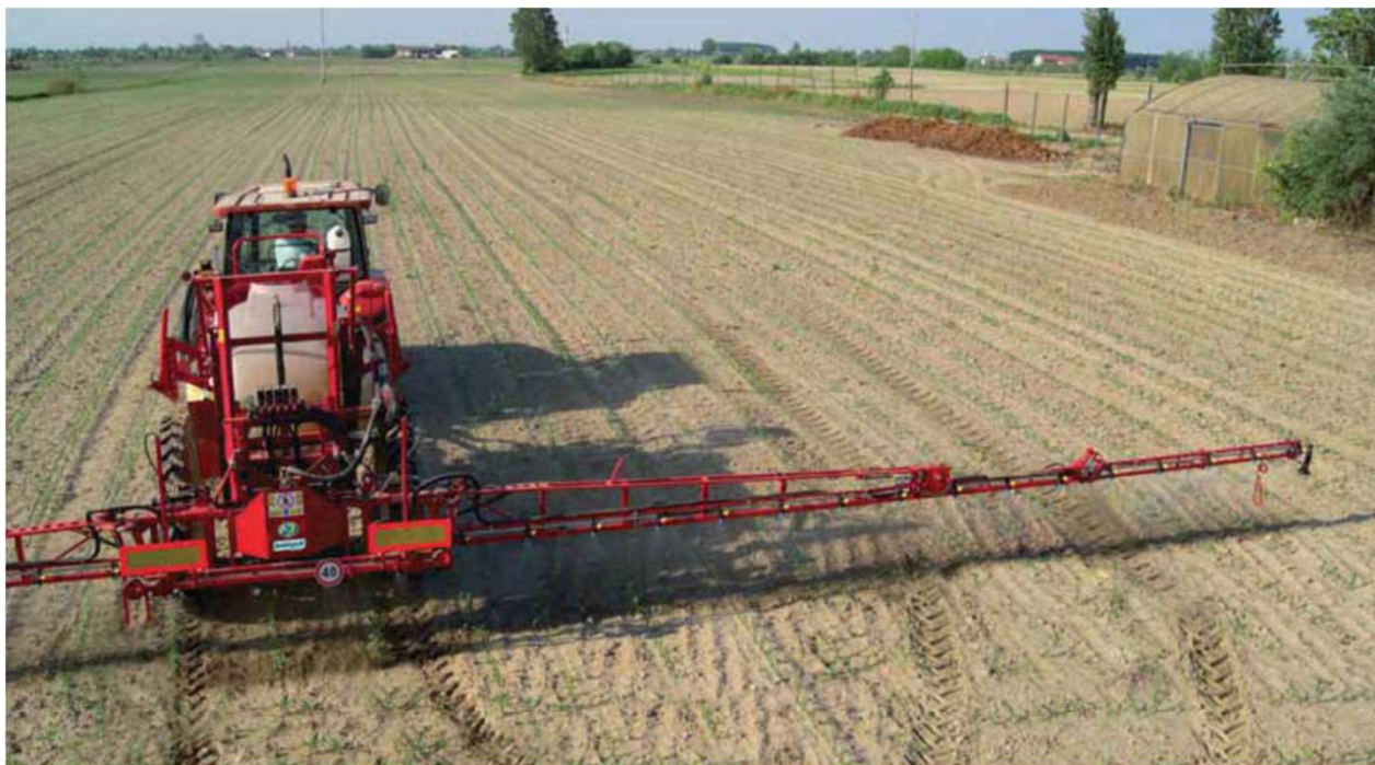
Botte irroratrice per trattamenti (trainata)