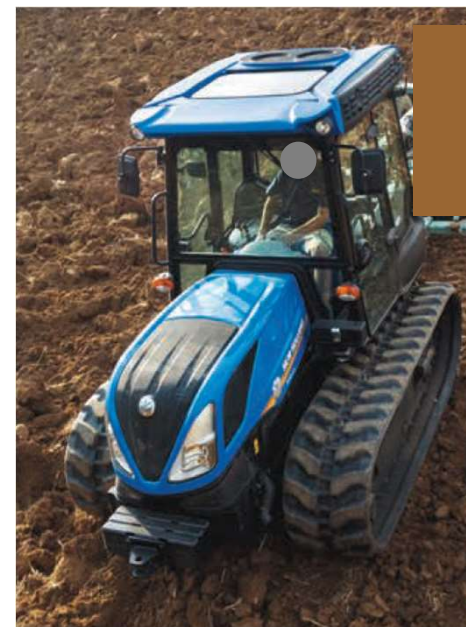
Trattore agricolo cingolato Direttiva Macchine 2006/42/CE

NB: non rilevano le caratteristiche del trattore da rottamare rispetto a quello acquistato